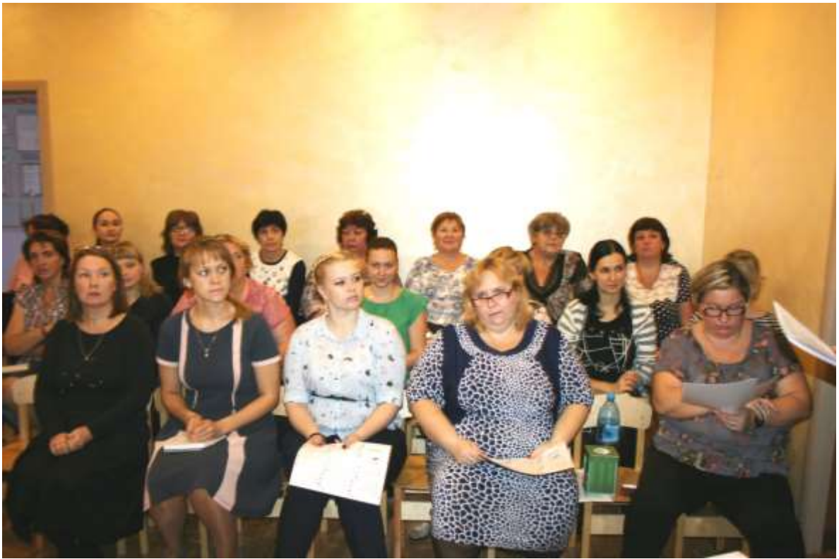
Сотрудникам МБДОУ также была представлена полная презентационная информация .